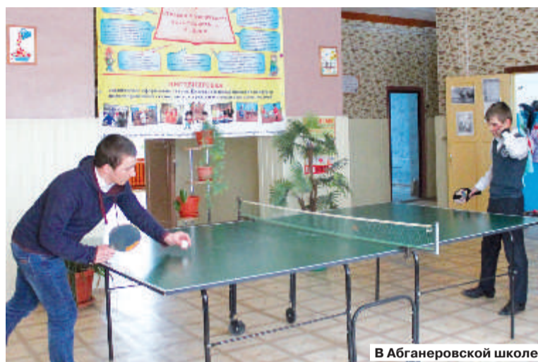
В Абганеровской школе

Начало большой работе по газификации бюджетных учреждений, строительству и реконструкции котельных для этих целей было положено на территории района в 2017 году. Перевод на газовое отопление социально-значимых объектов был назван одним из приоритетных направлений развития. Только на строительство котельных для объектов этой категории было направлено порядка 48 млн. рублей из областного бюджета.