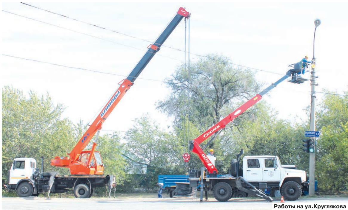
Работы на ул.Круглякова

Социально-значимый проект по восстановлению освещения улично-дорожной сети населенных пунктов Волгоградской области реализует в настоящее время ПАО «Волгоградоблэлектро».