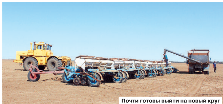
Почти готовы выйти на новый круг