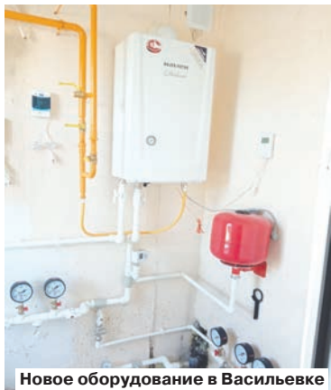
Новое оборудование в Васильевке

Продолжается газификация населенных пунктов Октябрьского района. Особое внимание – подключению к газовым сетям объектов соцкультбыта.