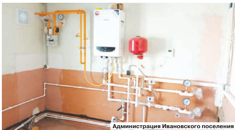
Администрация Ивановского поселения

Как уже писала наша газета, интенсивная работа в этом направлении велась в Васильевском, Громославском, Ивановском сельских поселениях. Кроме строительства автономных котельных к зданиям Ивановской школы, Дома культуры с.Ивановка