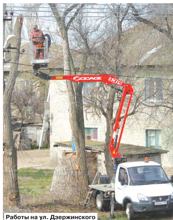
Работы на ул. Дзержинского